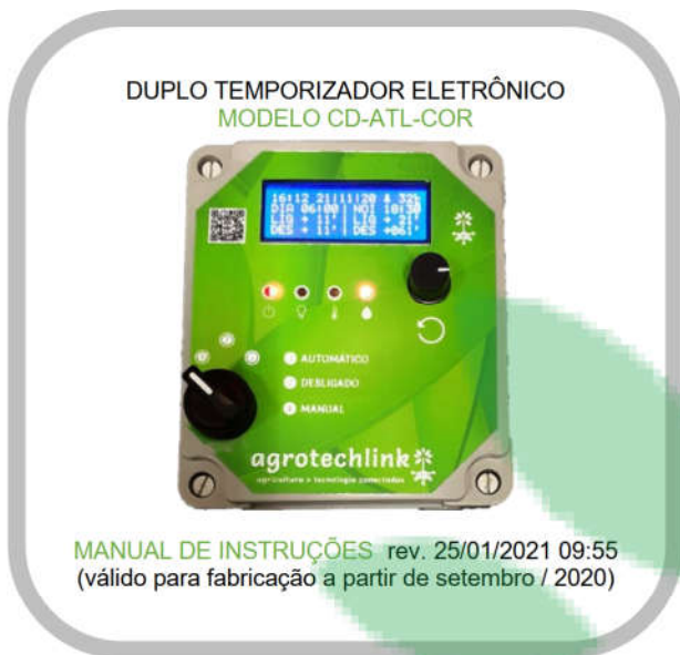
Figura 7—1: Disposição das informações no visor: modo OPERAÇÃO [⏏].