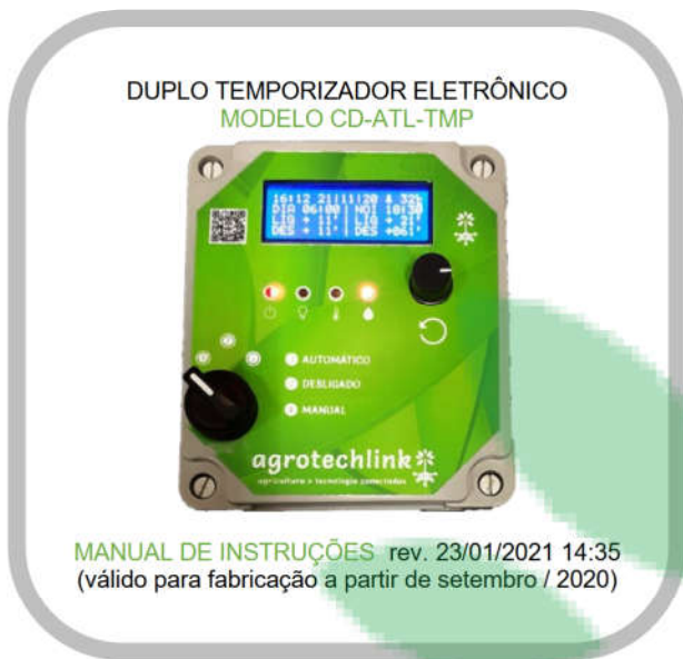
MANUAL DE INSTRUÇÕES rev. 23/01/2021 14:35 (válido para fabricação a partir de setembro / 2020)